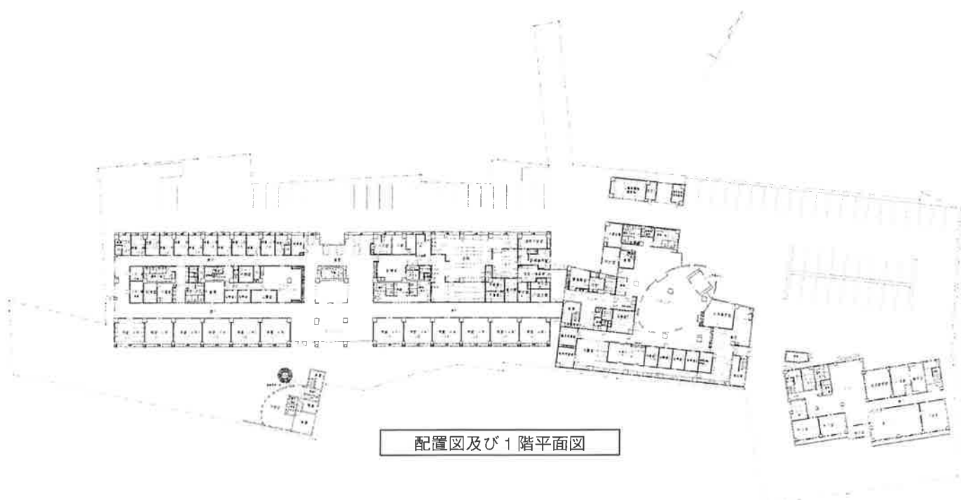
配置図及び1階平面図